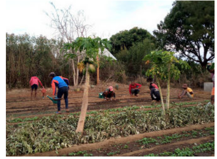
Devenir agriculteur, un apprentissage de tous les jours.