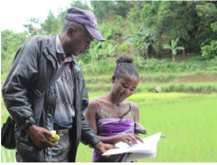
Après leur formation, les jeunes sont accompagnés dans leur projet.