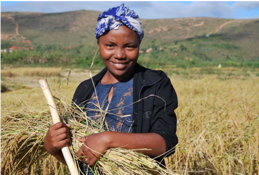
Les filles représentent le tiers des effectifs des élèves des collèges agricoles.