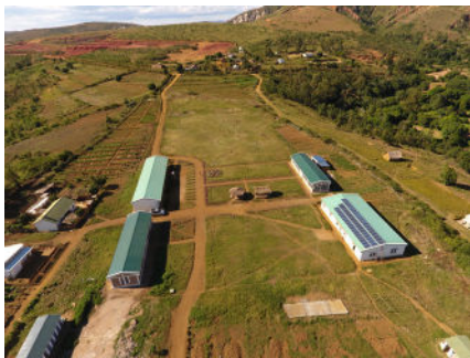
Le collège agricole d'Ambatondrazaka, situé au nord-est de la capitale.