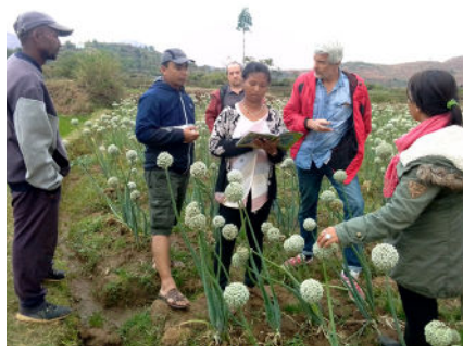
Le Cneap effectue de nombreuses missions d'appui dans les collèges.